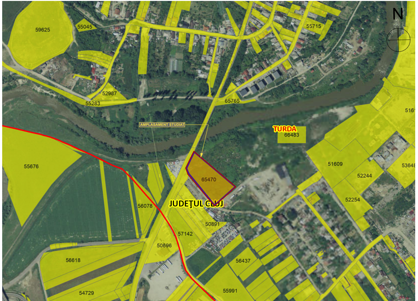
PLAN DE INCADRARE IN PUG